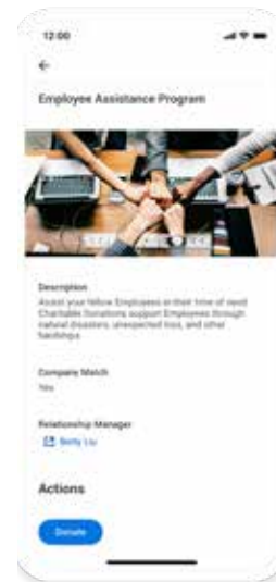
기본적으로 지원되는 모바일