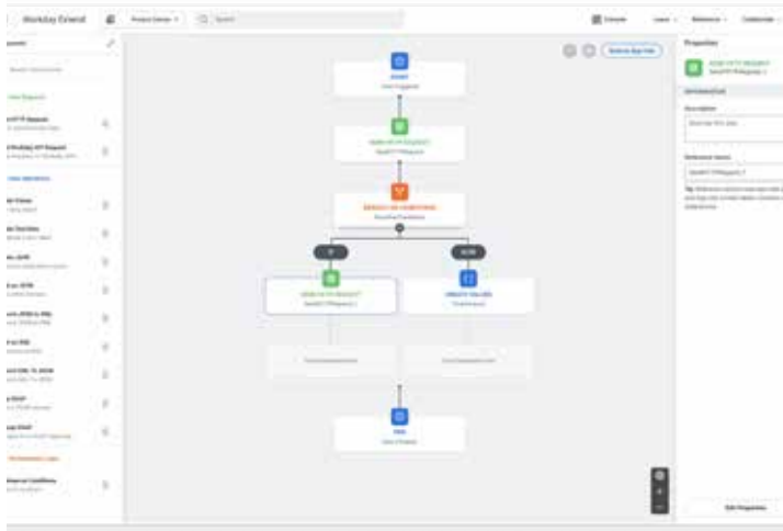
오케스트레이션 빌더는 실시간 이벤트 기반 오케스트레이션을 구현, 테스트, 배포하는 드래그앤드롭 도구입니다.

별도의 노력과 비용 지출 없이 Workday 데이터 및 보안을 어디서나 활용합니다. 따라서 팀이 기술이 아닌 가치 제공에 집중할 수 있습니다.